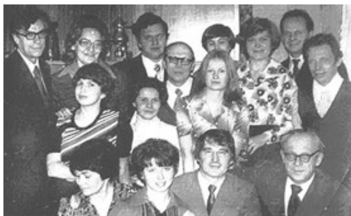
Рис. 5. Группа преподавателей кафедры матобеспечения ЭВМ и сотрудников ВЦ ЛГУ в 1970-х годах